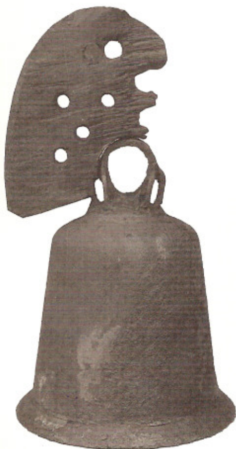
Hedebyklokken, der er Nordens ældste bevarede kirkeklokke. Den er dateret tilbage til omkring år 900.

Det kan lokalt overvejes at genoptage nogle af dem. Om beskrivelse af lokale ringeskikke henvises til afsnittet "Beskrivelse af lokale ringeskikke" side 10.